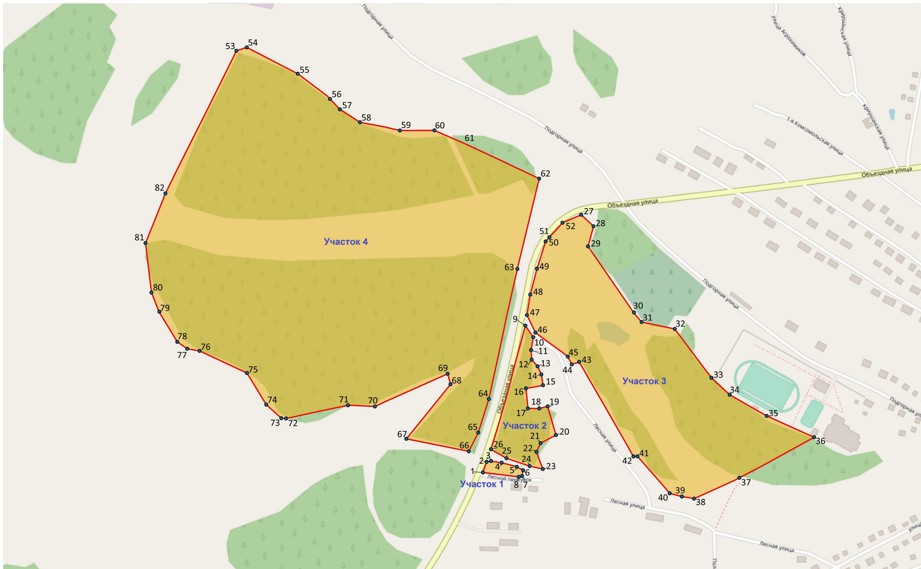
КАРТА-СХЕМА ПАМЯТНИКА ПРИРОДЫ «ОКРЕСТНОСТИ СЕЛА ВАГАЙ» М 1:5 000