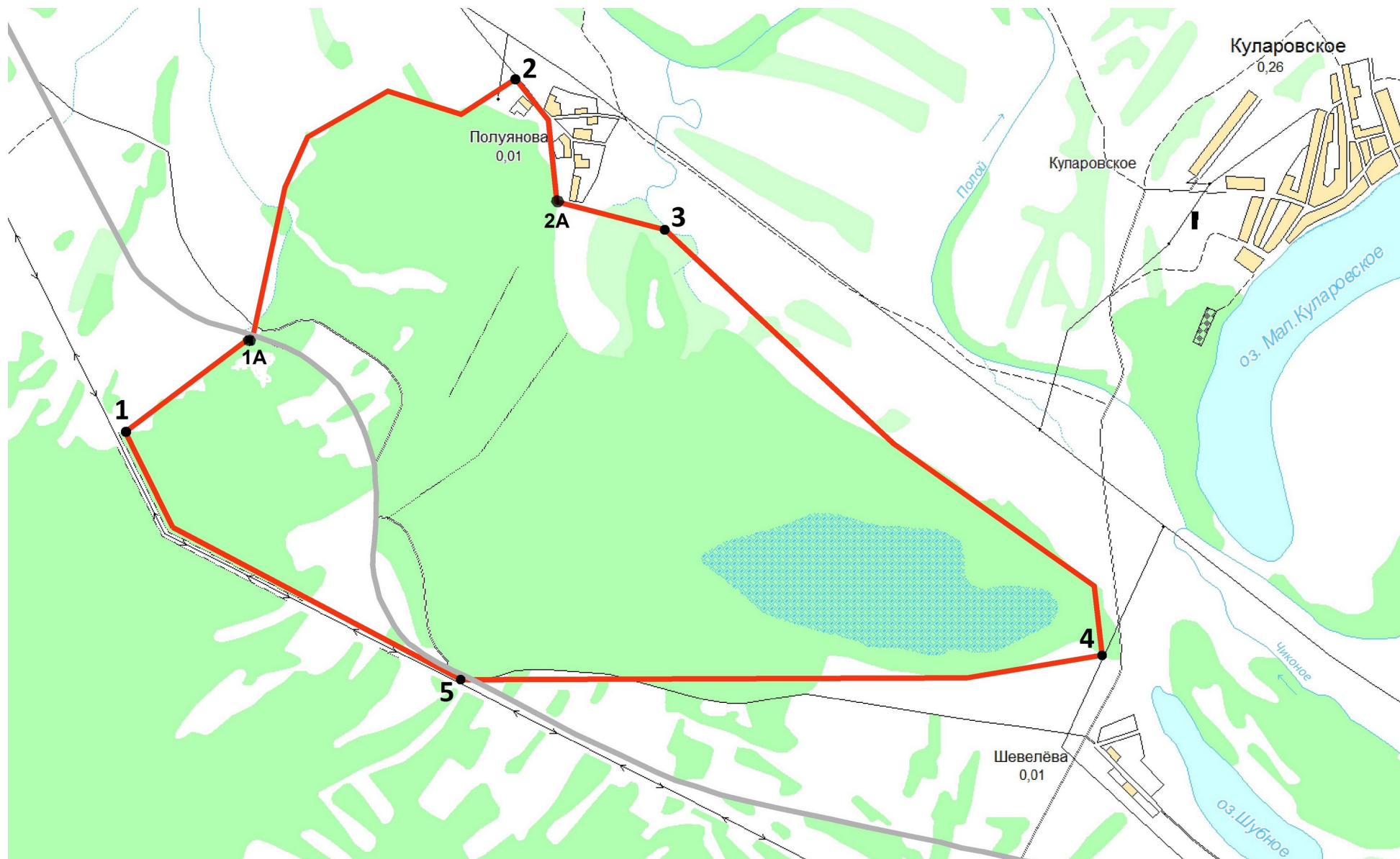
КАРТА-СХЕМА ПАМЯТНИКА ПРИРОДЫ «ПОЛУЯНОВСКИЙ БОР» М 1:25 000