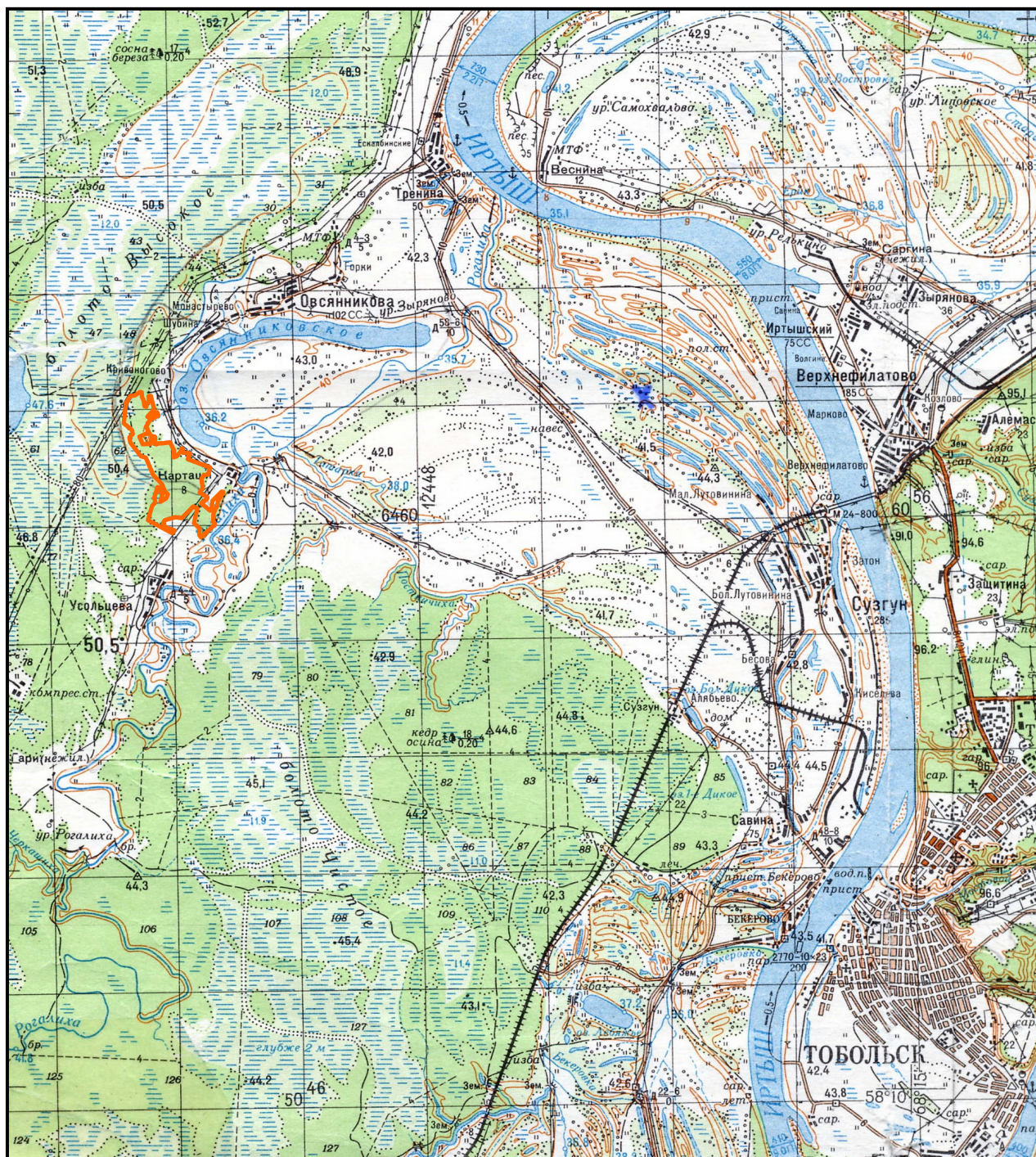
ОБЗОРНАЯ КАРТА ПАМЯТНИКА ПРИРОДЫ РЕГИОНАЛЬНОГО ЗНАЧЕНИЯ «КАРТАШОВСКИЙ БОР» М 1:100 000