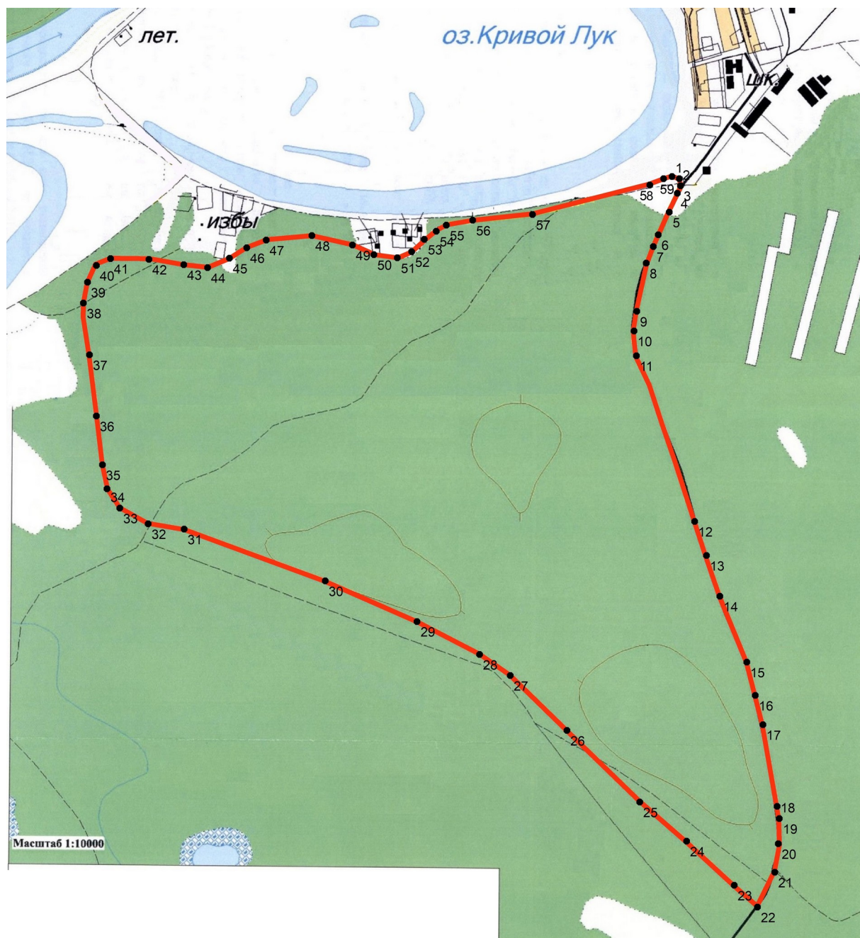
КАРТА-СХЕМА ПАМЯТНИКА ПРИРОДЫ РЕГИОНАЛЬНОГО ЗНАЧЕНИЯ «КРИВОЛУКСКИЙ БОР» М 1:15 000